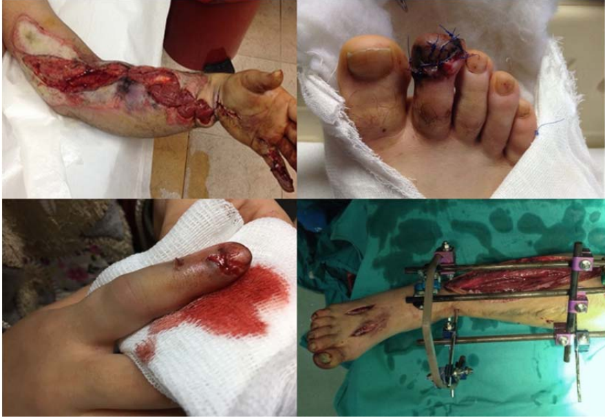
Şekil 1: Akut travmatik iskemi ile HBO tedavisine yönlendirilen hastaların klinik görünümüne örnek fotoğraflar.

Hastaların klinik durumu incelendiğinde %64'ünün açık kırık ile başvurduğu görülmüştür. Gustillo açık kırık sınıflamasına göre bunların 25'i damar yaralanması da içeren ciddi olarak tanımlanan tip 3C; 6'sı tip 3B; 7'si tip 3A ve 12'si tip 2 kırıklardı. Bu hastaların 4'ünde ayrıca kompartman sendromu da vardı. Kırık olmaksızın izole kompartman sendromu ise hiç görülmedi. Diğerleri flep ya da avulsiyon tarzı yumuşak doku yaralanmaları (23 hasta) ve bir de donuktur. Yaralanma örnekleri Şekil 1 'de görülebilir.